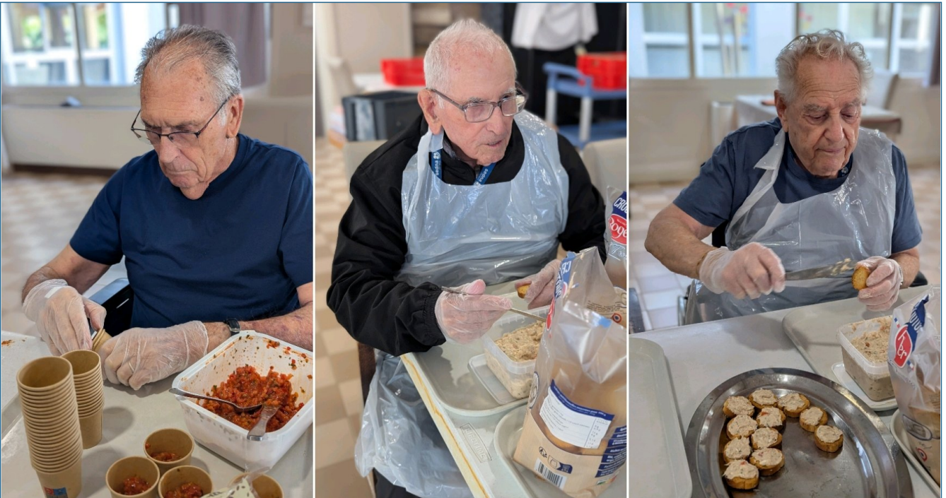
Jeudi 11 juin , préparation de l'apéritif du mois