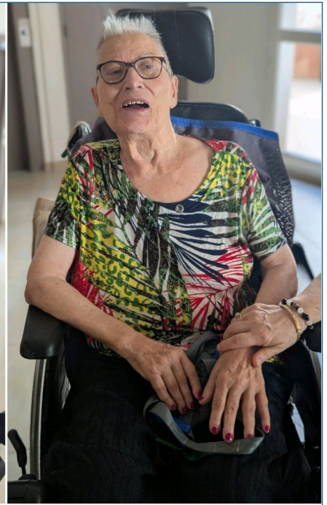
Atelier "bar à ongles" et les dames sont ravies !