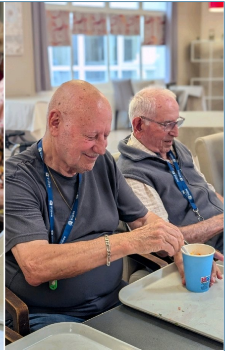
Boisson détox : dégustation