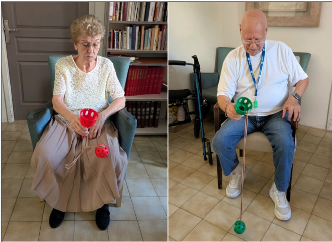
Gym douce : concours de bilboquet