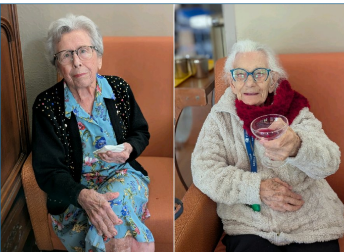
Le thème de notre apéritif du mois : tapas et sangria!