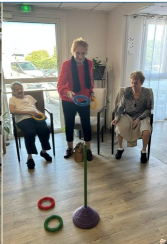
la gym douce c'est aussi des jeux d'adresse