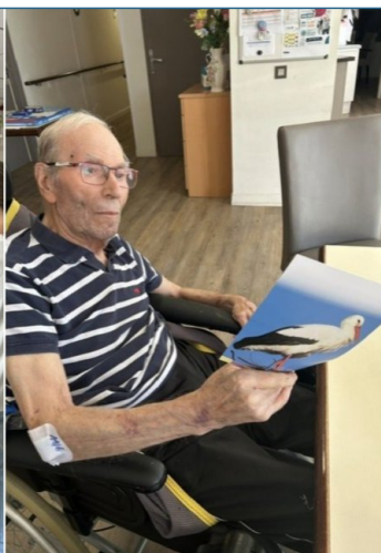
Et l'après midi, place aux jeux!