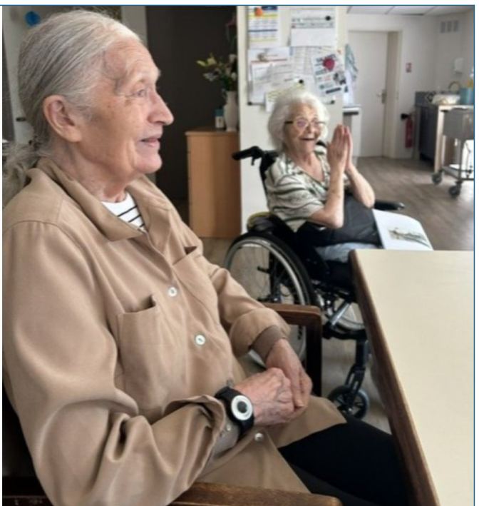
PASA : on chante avec Luis Mariano