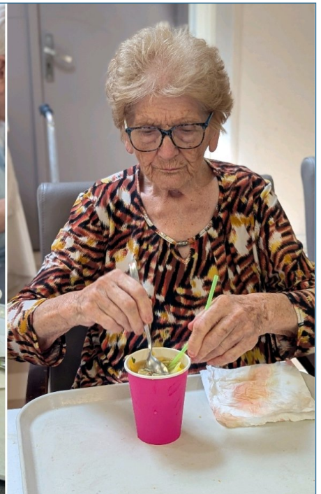
Boisson détox : dégustation