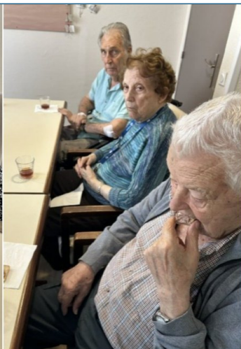
Apéro au PASA : Convivialité et partage