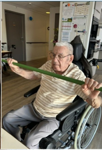
Petite séance de gym douce au PASA