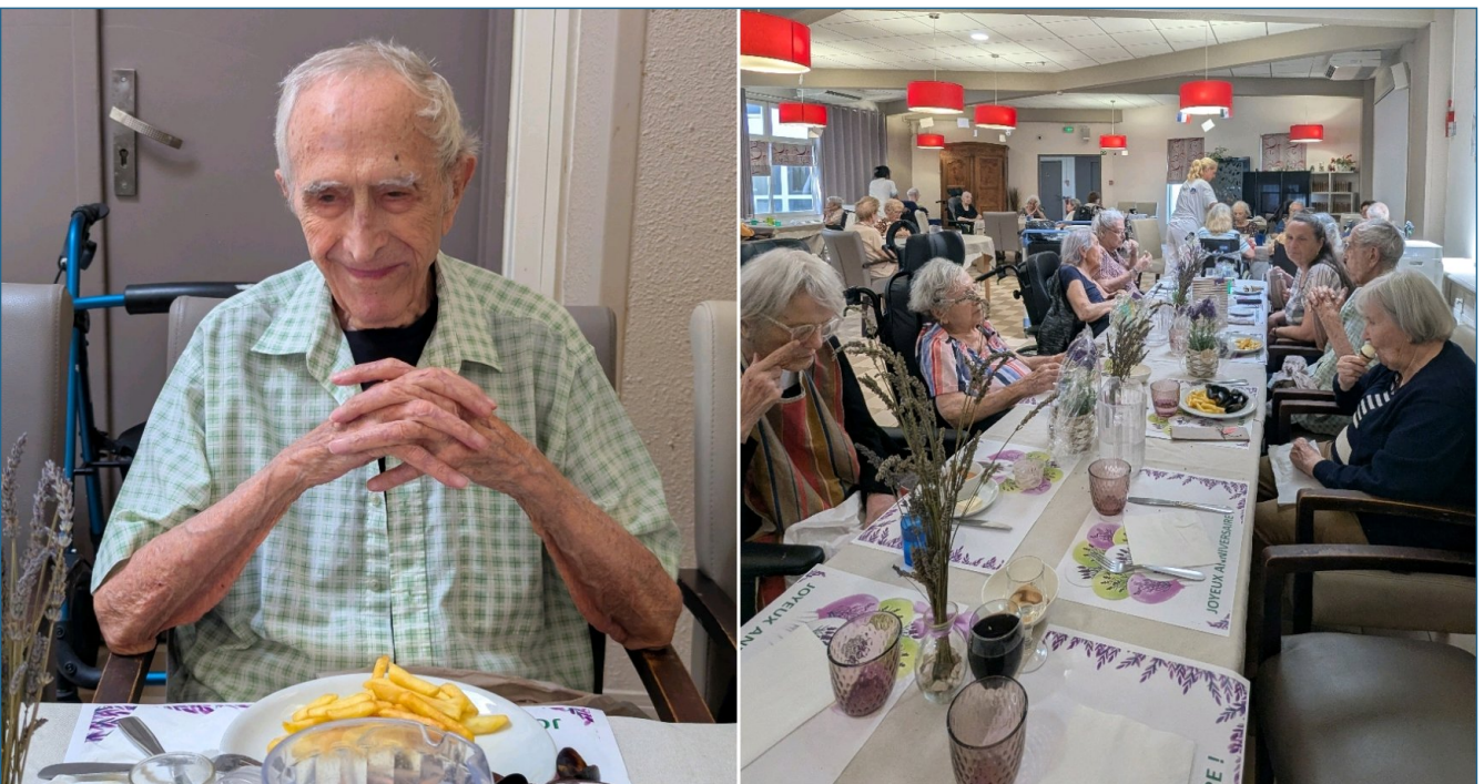
Et en plus c'est moules frites!