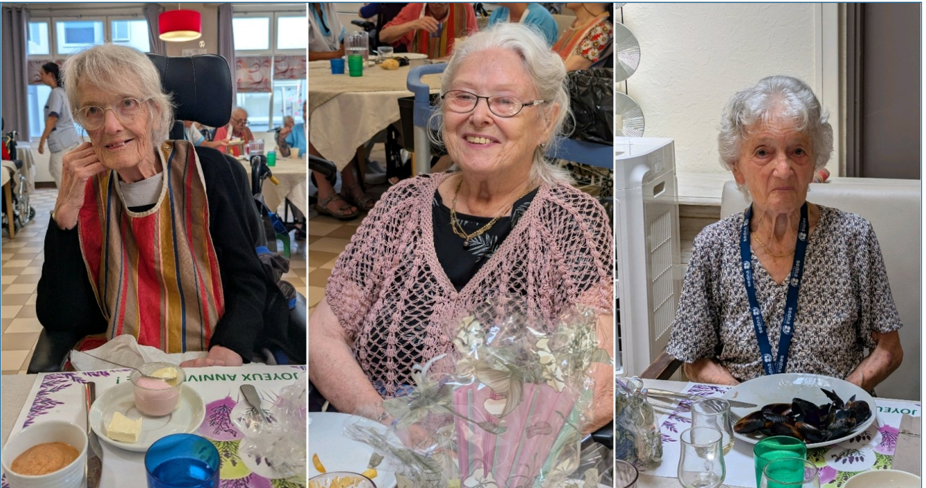
Une jolie tablée VIP née en juin !