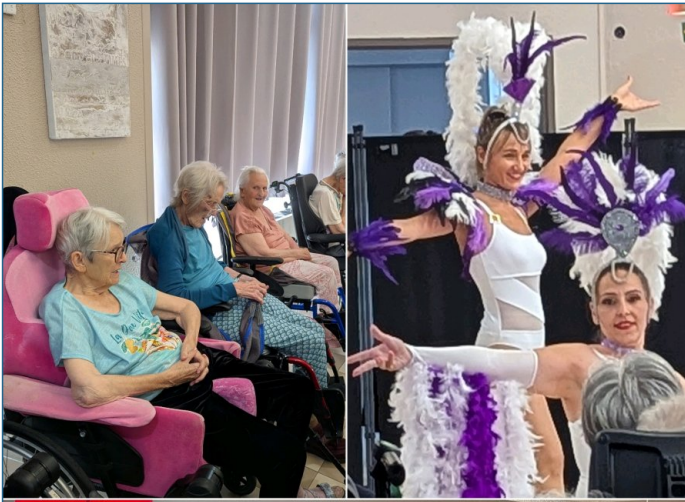
Une jolie troupe féminine parée de plumes