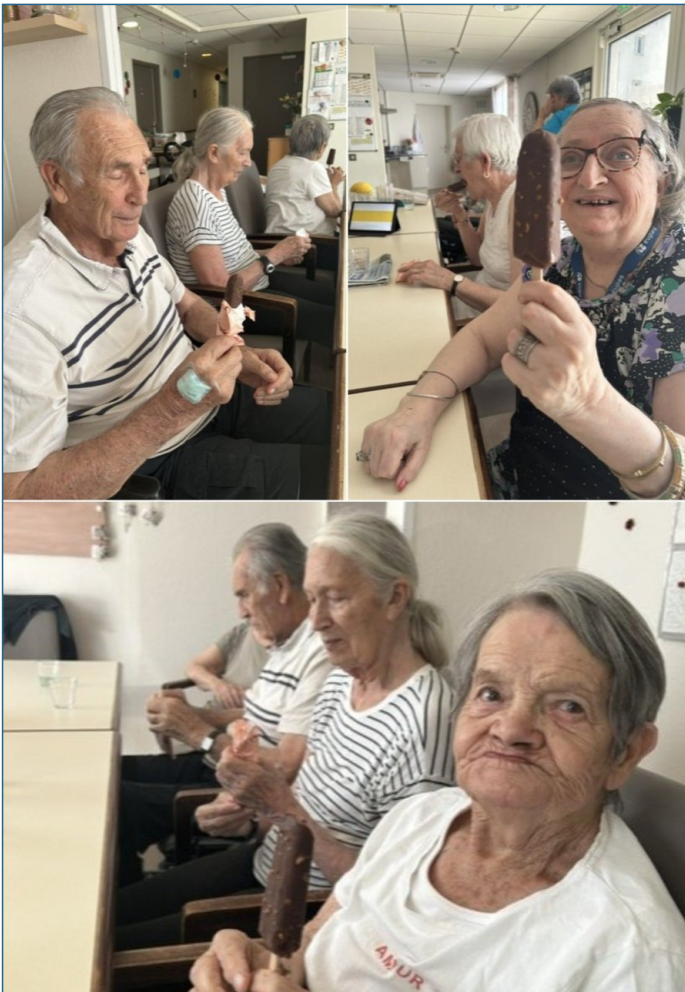
Personne ne résiste à une bonne glace avec ces chaleurs !