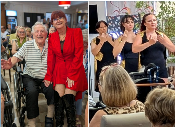
Et un Mr B. comblé...